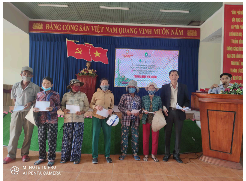
Hình từ thiện tại Quảng Nam