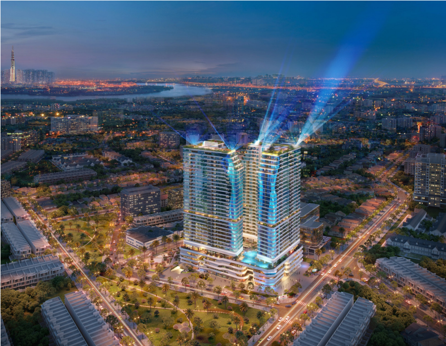
King Crown Infinity

Trong “nguy” có “cơ”, trong thử thách, thay đổi sẽ mở ra những cơ hội mới, con đường mới, vấn đề là ta phải có đủ dũng cảm đương đầu một cách tích cực, nhận diện rõ cơ hội và kiên trì thực hiện mục tiêu hay không.