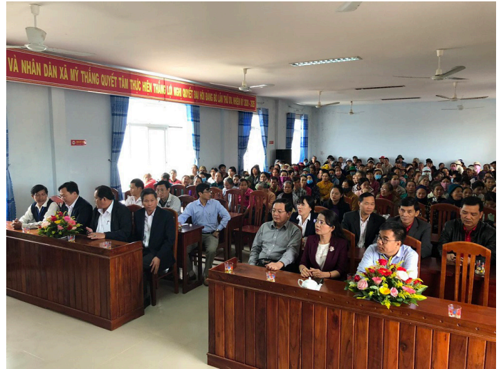
Hình từ thiện tại Bình Định

Ngày 1/2, Quỹ Bamboo Foundation và Công ty Indochina Hội An Beach Villas đã phối hợp cùng UBND phường Điện Dương, thị xã Điện Bàn (Quảng Nam) trao 100 phần quà Tết cho các mẹ Việt Nam anh hùng, các hộ nghèo, người cao tuổi có hoàn cảnh neo đơn.