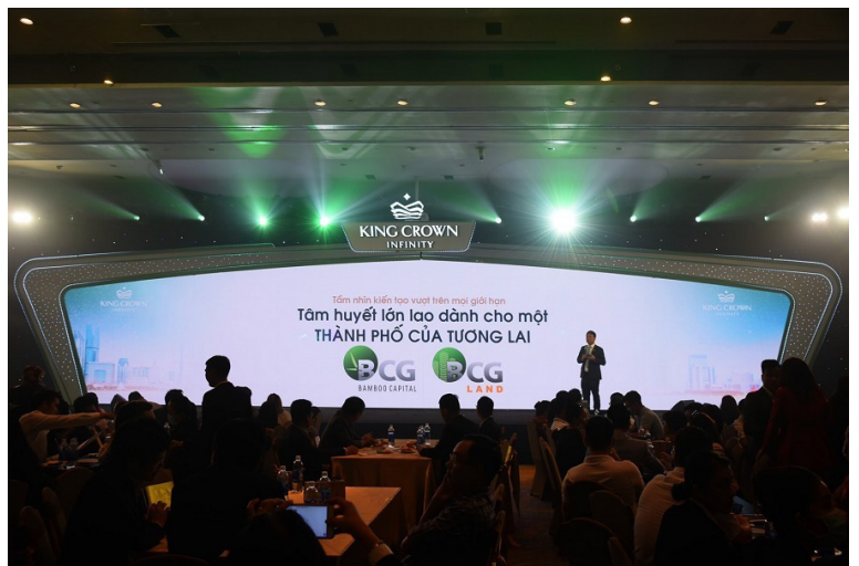
King Crown Infinity là dự án đầy tâm huyết của BCG Land

Mặc dù mới ra mắt thị trường nhưng dự án đã tạo được tiếng vang lớn với tòa tháp đôi cao 30 tầng Apollo và Artemis có thiết kế mang tính biểu tượng, tọa lạc ngay vị trí huyết mạch giữa trái tim thành phố Thủ Đức. Lấy cảm hứng từ trường phái kiến trúc giải tỏa kết cấu của “Queen of the Curve” Zaha Hadid, King Crown Infinity mang đến cho kiến trúc đô thị Thành phố mới một diện mạo mới, vượt lên trên khuôn mẫu của những lối kiến trúc thông thường.