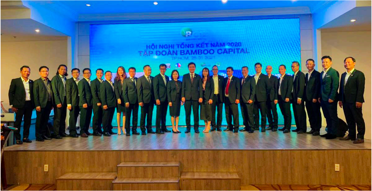
Các cán bộ lãnh đạo BCG tham gia hội nghị

Ngày 25/01 vừa qua, Tập đoàn Bamboo Capital (BCG) vừa tổ chức Hội nghị Tổng kết năm 2020 nhằm đánh giá hoạt động sản xuất, kinh doanh trong năm 2020 và định hướng hướng phát triển trong năm 2021.