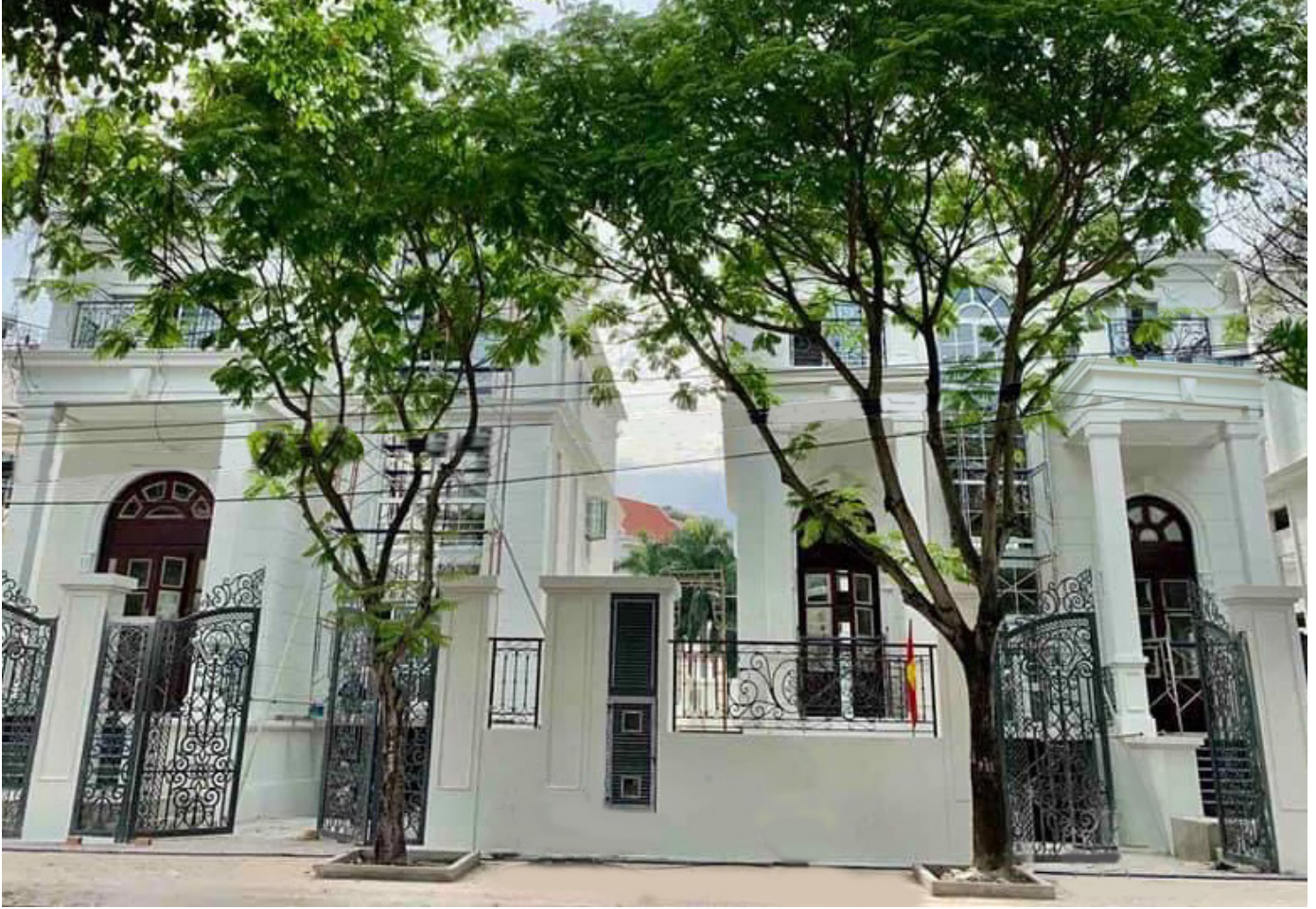
Biệt thự King Crown Village được thiết kế theo phong cách châu Âu sang trọng

Biệt thự King Crown Village được Công ty quốc tế Zone Architect thiết kế theo phong cách châu Âu lịch lãm, sang trọng. Từng chi tiết trong thiết kế được trau chuốt tỉ mỉ, chắt lọc từ những điểm nhấn kiến trúc độc đáo của vùng Lyon, Marseille, Bordeaux và Monaco. Bên cạnh đó, dự án còn sở hữu tiện ích nội khu đẳng cấp, đa dạng nhằm phục vụ tốt nhất đời sống cư dân như: khách sạn cao cấp, trung tâm thương mại, hồ bơi, phòng tập gym, khu vui chơi trẻ em, sân thể thao, công viên... Tất cả mang đến cho King Crown Village diện mạo sang trọng và khác biệt, trở thành chốn an cư lý tưởng mà giới thượng lưu tìm kiếm.