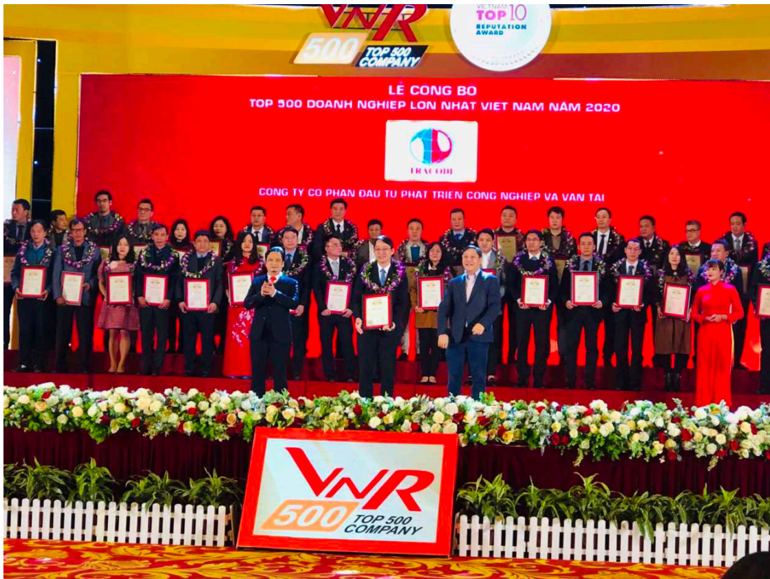
Tracodi vào top 500 doanh nghiệp lớn nhất Việt Nam 2021

TRACODI – thành viên của Tập đoàn Bamboo Capital là công ty có bề dày lịch sử với 30 năm hình thành và phát triển. Các lĩnh vực hoạt động chính của TRACODI là Xây dựng công trình giao thông, công nghiệp, dân dụng; Khai thác và chế biến đá xây dựng; Sản xuất và thương mại nông sản; Xuất khẩu lao động. Đây là lần thứ 4 liên tiếp TRACODI khẳng định vị thế của mình khi lọt vào Top 500 doanh nghiệp lớn nhất Việt Nam. Chỉ riêng 3 quý đầu năm 2020, doanh thu lũy kế của TRACODI đạt hơn 1.600 tỉ đồng. Đây được xem là kết quả kinh doanh tích cực trong một năm biến động chưa từng có trong lịch sử do ảnh hưởng từ đại dịch COVID-19.