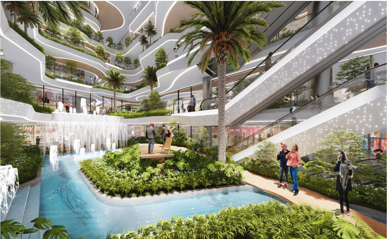
King Crown Infinity là dự án đầu tiên tại Việt Nam có mô hình "phố đi bộ trong nhà"

Sự kiện ra mắt chính thức King Crown Infinity ghi dấu ấn mạnh mẽ với các nhà đầu tư tham dự bởi phần tư vấn chuyên sâu về những tiện ích nổi bật của dự án. Trong đó các nhà đầu tư đặc biệt hứng thú với điểm nhấn “phố đi bộ trong nhà” đầu tiên tại Việt Nam của dự án được lấy cảm hứng từ Namba Park (Nhật Bản).