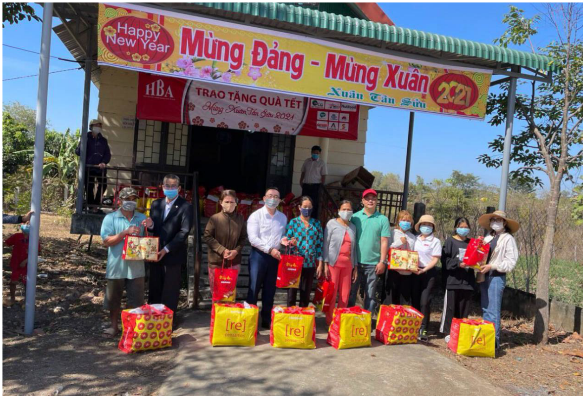
Hình từ thiện Đắk Lắk

Ngày 6/2, BCG phối hợp cùng Hiệp hội các doanh nghiệp khu công nghiệp TP.HCM (HBA) trao quà từ thiện tại các buôn làng nơi còn nhiều đồng bào dân tộc thiểu số có hoàn cảnh khó khăn vùng biên giới tỉnh Đắk Lắk.