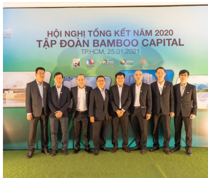
Các cán bộ lãnh đạo BCG tham gia hội nghị