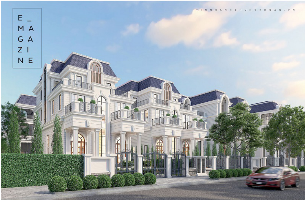
Dự án King Crown Village Thảo Điền