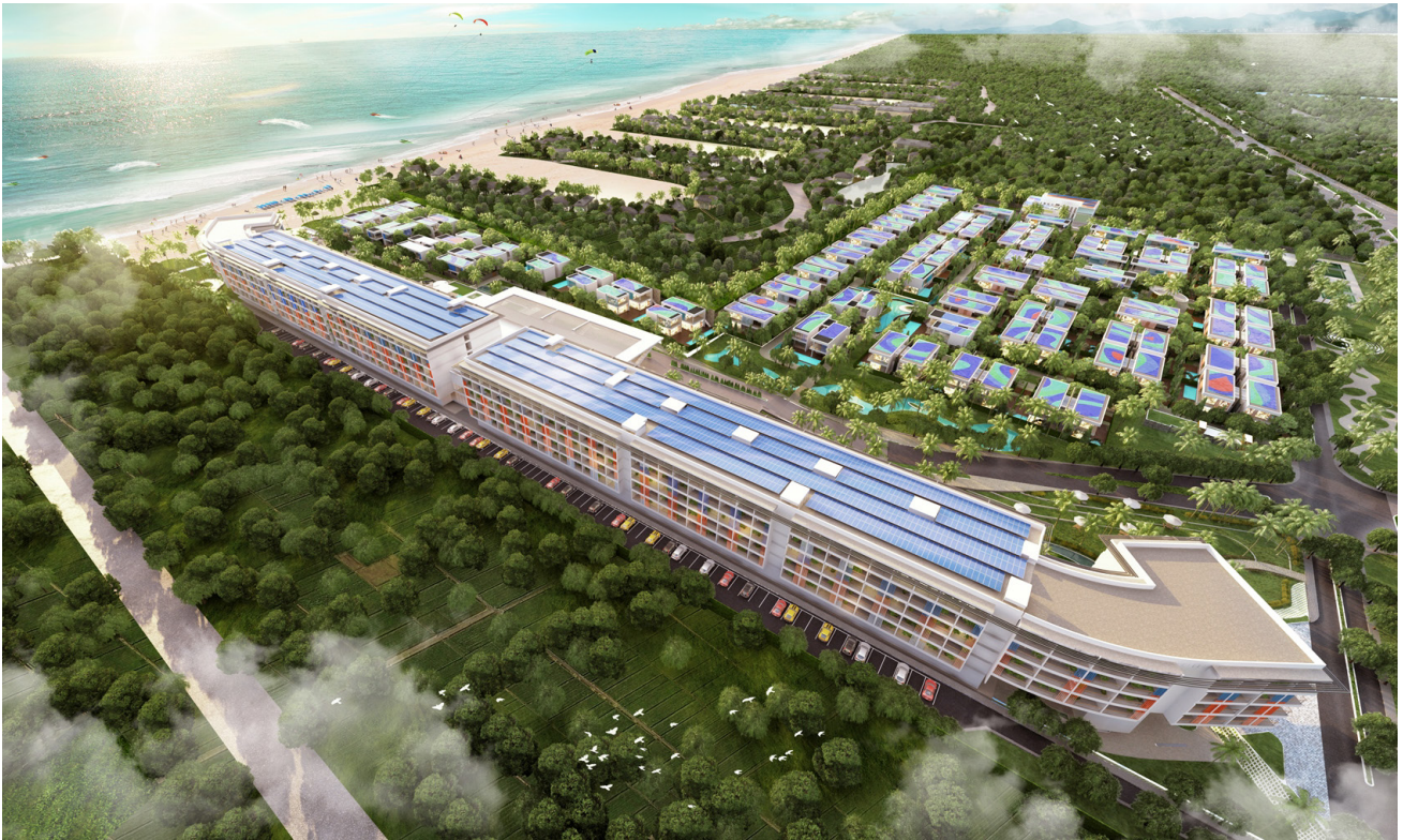
Dự án Malibu Hội An

Trong thời gian ngắn, BCG tiến hành hàng loạt các dự án bất động sản, tập trung vào phân khúc sản phẩm cao cấp. Các dự án nổi trội có thể kể đến là Malibu Hội An chuẩn quốc tế 5 sao với quy mô gần 1.000 căn hộ và biệt thự view biển; King Crown Village Thảo Điền (quận 2, TP.HCM) giai đoạn 1 quy mô 0,91 ha với 17 villa, tòa nhà căn hộ 14 tầng; Casa Marina Resort (Ghềnh Ráng, Quy Nhơn) quy mô 1,5 ha; Casa Marina Premium (Ghềnh Ráng, Quy Nhơn) quy mô 12 ha.