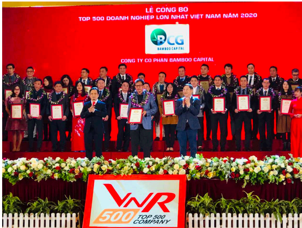
Tập đoàn Bamboo Capital vào top 500 doanh nghiệp lớn nhất Việt Nam 2020

Bảng xếp hạng VNR500 dựa trên kết quả nghiên cứu và đánh giá độc lập theo chuẩn mực quốc tế của Vietnam Report, được công bố thường niên bởi báo Vietnamnet. Đây là năm thứ 14 Bảng xếp hạng VNR500 được công bố nhằm tôn vinh các doanh nghiệp có quy mô lớn, đạt hiệu quả cao trong hoạt động sản xuất kinh doanh, đóng góp lớn cho sự phát triển chung của nền kinh tế Việt Nam. Hội đồng đánh giá bao gồm nhiều chuyên gia đến từ Đại học Harvard (Hoa Kỳ) và các tổ chức kinh tế, tư vấn thương hiệu hàng đầu Việt Nam.