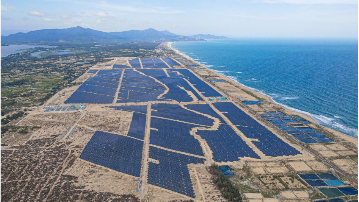
Nhà máy năng lượng mặt trời Phù Mỹ 330 MW tại Bình Định

Kết quả này cùng với việc xin quy hoạch thành công dự án bất động sản Casa Marina (giai đoạn 2), dự án King Crown Infinity ở Thủ Đức - TP.HCM và dự án King Crown Village ở Thảo Điền - TP.HCM (giai đoạn bàn giao), BCG đã có một năm 2020 hết sức thành công ở cả hai mảng chiến lược.