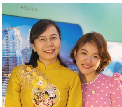
Một số hình ảnh về hội nghị