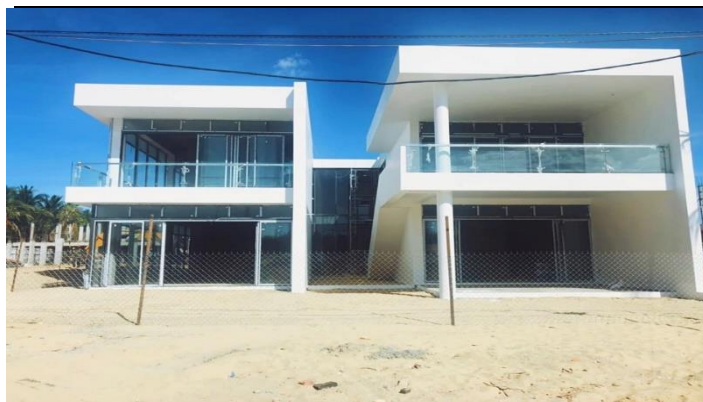
Biểu đồ 2: Khu nhà Villa mẫu của dự án Malibu