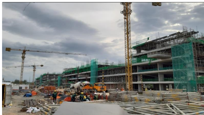
Hình 6: Tiến độ thi công khối Condotel