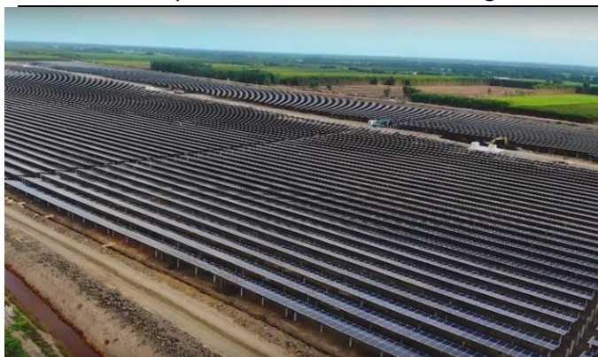
Hình 7: Nhà máy điện mặt trời BCG – CME Long An 2