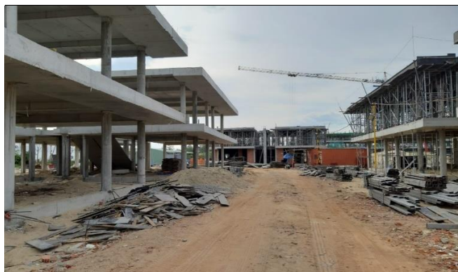
Hình 5: Tiến độ thi công Khu vực Villa