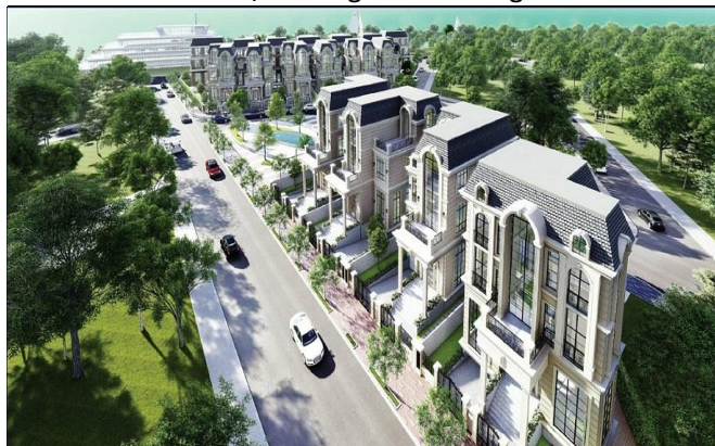
Hình 7: Phối cảnh dự án King Crown Village

kế hoạch, các hạng mục của giai đoạn 1 của dự án sẽ bàn giao vào cuối năm 2019.