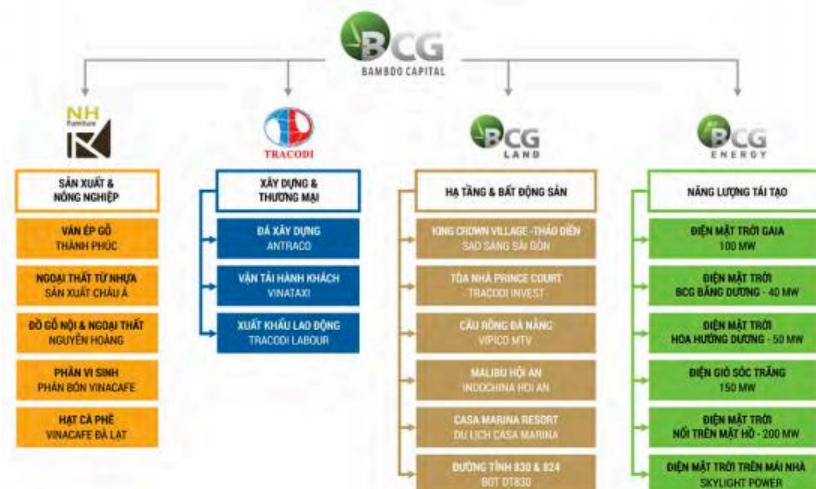
Bảng 1: Cấu trúc công ty Cổ phần Bamboo Capital