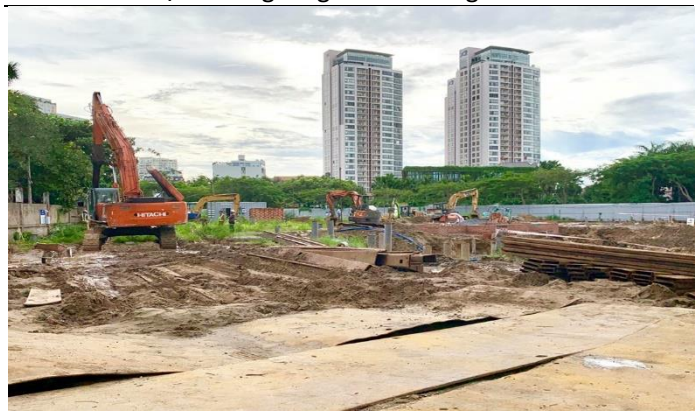
Hình 8: Tiến độ thi công King Crown Village Thảo Điền