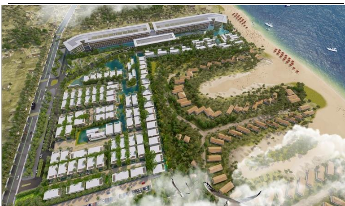
Hình 3: Phối cảnh dự án Malibu Hội An