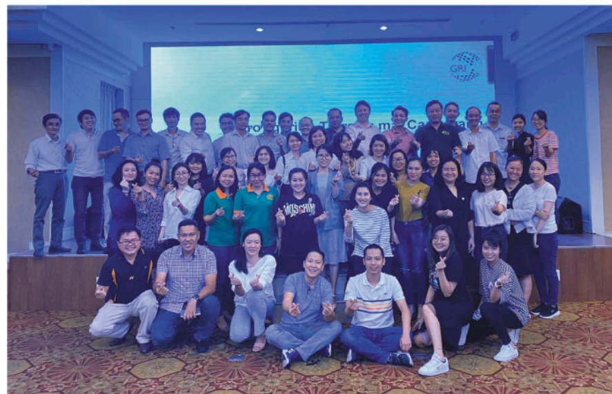
Khóa đào tạo "Phương pháp xây dựng báo cáo về phát triển bền vững" cho cấp quản lý cùng các cán bộ nhân viên hiện đang công tác tại tổng công ty và các công ty thành viên thuộc Tập đoàn vào hai ngày 29/02/2020 và 01/03/2020.

Nguyễn Hoàng đã giành được giải thưởng doanh nghiệp tiêu biểu do tỉnh Bình Định trao tặng năm 2018. Đây là minh chứng cho sự cố gắng của Nguyễn Hoàng trên con đường trở thành đơn vị tiêu biểu, tiên phong trong lĩnh vực sản xuất sản phẩm đồ gỗ nội, ngoại thất.